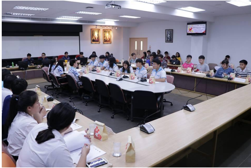
ภาพที่ 1.1 บรรยากาศการประชุม ณ มหาวิทยาลัยธรรมศาสตร์ ศูนย์ลำปาง