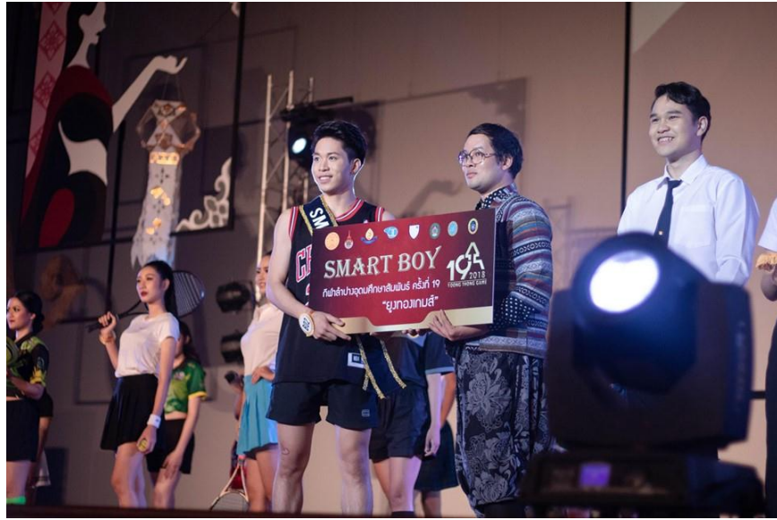
ภาพที่ 1.13 รางวัล SMART BOY กีฬาลำปางอุดมศึกษาสัมพันธ์ ครั้งที่ 19 “ยูงทองเกมส์”