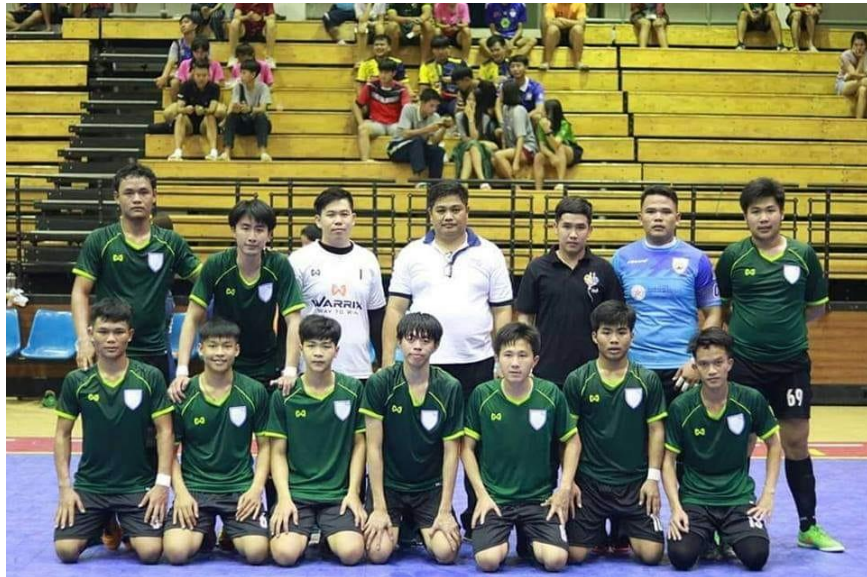
ภาพที่ 1.10 ทีมฟุตซอลชาย