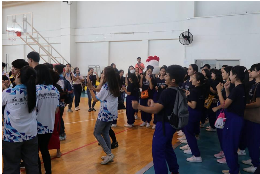
ภาพที่ 1.6 ภาพบรรยากาศของเชียร์วันพีธีเปิด-ปิด ณ มหาวิทยาลัยธรรมศาสตร์ ศูนย์ลำปาง