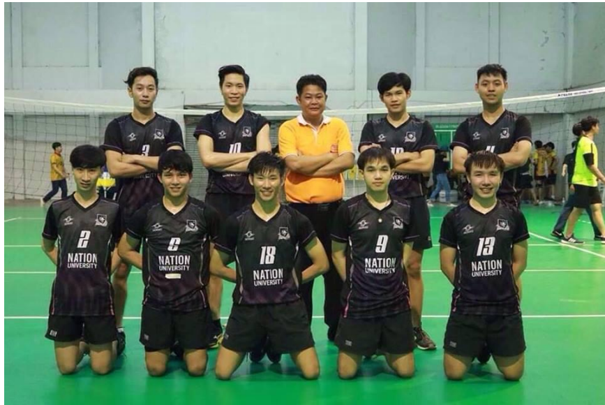
ภาพที่ 1.8 ทีมวอลเลย์บอลชาย