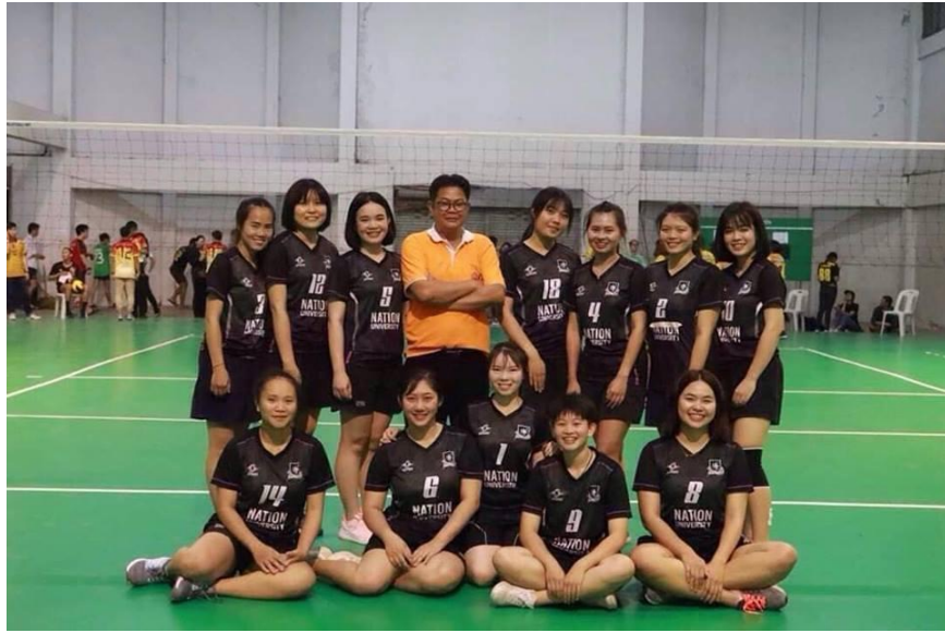
ภาพที่ 1.7 ทีมวอลเลย์บอลหญิง