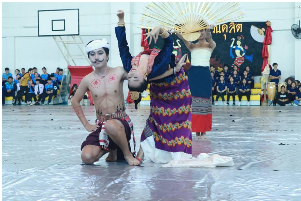
ภาพที่ 1.14 การแสดงร่วมในพิธีเปิด

ภาพแสดงการประกาศผลกีฬาที่ได้รับรางวัลต่างๆ