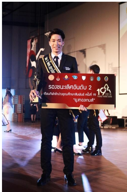
ภาพที่ 1.12 รางวัลรองชนะเลิศอันดับ 2 เดือนกีฬาปาปางอุดมศึกษาสัมพันธ์ ครั้งที่ 19 “ยูทอเกมส์”