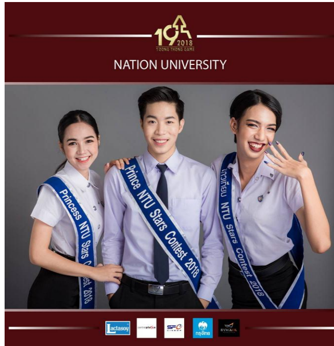
ภาพที่ 1.11 ภาพประชาสัมพันธ์การแข่งขัน ดาว เดือน และดาวเทียม