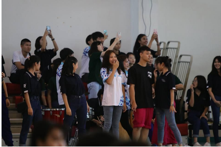
ภาพที่ 1.5 ภาพบรรยากาศของเชียร์วันพีธีเปิด-ปิด ณ มหาวิทยาลัยธรรมศาสตร์ ศูนย์ลำปาง