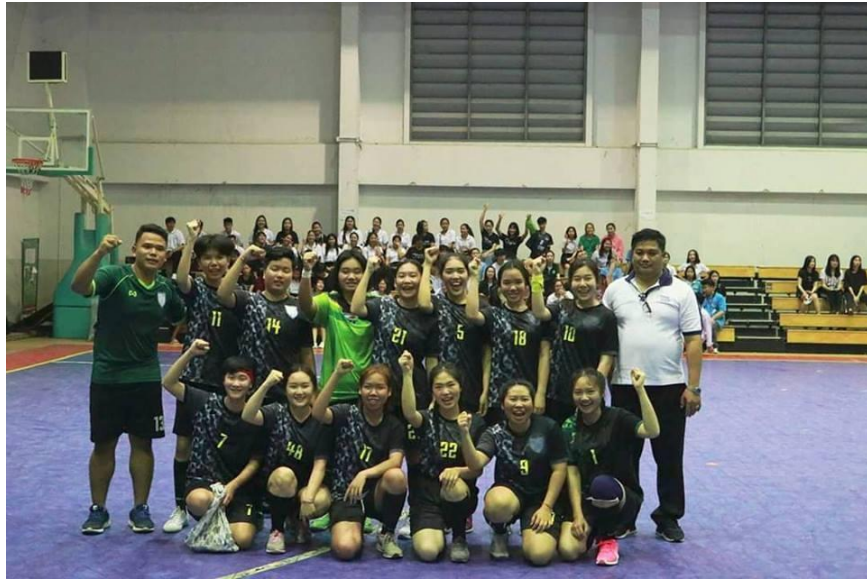
ภาพที่ 1.9 ทีมฟุตซอลหญิง