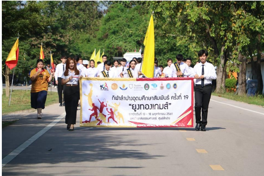
ภาพที่ 1.3 การเดินขบวนในพิธีเปิด- ปิดโครงการฯ ณ มหาวิทยาลัยธรรมศาสตร์ ศูนย์ลำปาง