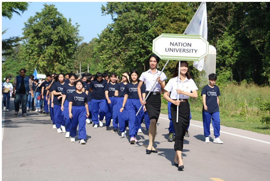
ภาพที่ 1.4 การเดินขบวนในพิธีเปิด- ปิดโครงการฯ ณ มหาวิทยาลัยธรรมศาสตร์ ศูนย์ลำปาง ณ มหาวิทยาลัยธรรมศาสตร์ ศูนย์ลำปาง