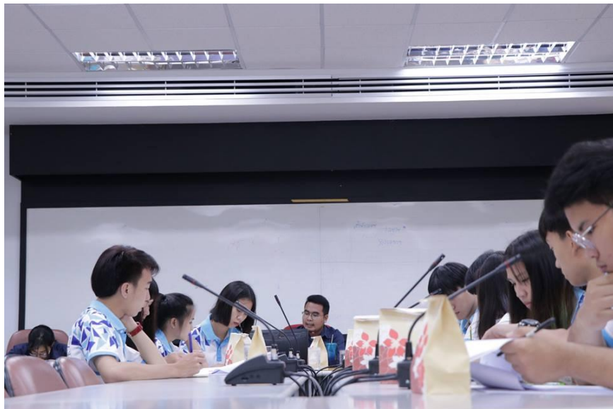
ภาพที่ 1.2 บรรยากาศการประชุม ณ มหาวิทยาลัยธรรมศาสตร์ ศูนย์ลำปาง